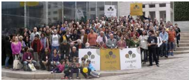
Inauguració de la seu del grup cooperatiu Ecos el 26 de juny de 2012 a Barcelona.