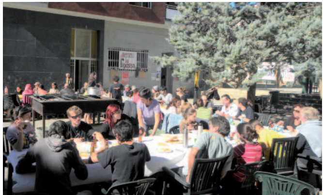
Botifarrada a la Hispanitat

L'Ateneu la Pigassa es financia amb les aportacions dels socis i dels col·lectius, i funciona gràcies al treball desinteressat de moltes persones que hi donen suport i que hi treballen d'una manera voluntària i constant. Que el pròxim 1 de maig, a més del dia del treball, puguem celebrar el primer aniversari de l'Ateneu és responsabilitat de totes plegades.