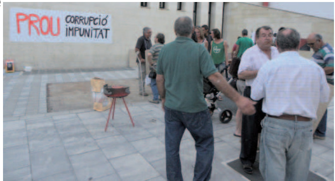
Protesta davant de la seu del PP

Des de la calçotada de l'1 de maig, en que una vuitantena de persones vam celebrar la inauguració de la Pigassa, hem realitzat xerrades, actes polítics, presentacions de llibres, sopars i tertúlies. Hem assistit al naixement de la PAH al Pallars, que s'ha incorporat com a col·lectiu actiu dins de l'Ateneu, juntament amb la CUP i l'Ecoxarxa.