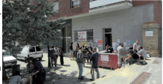
Calçotada de l'1 de Maig

Aquest passat 1 de novembre es van complir els sis mesos d'activitat oberta al públic de l'Ateneu la Pigassa. Durant aquest temps, han passat centenars de persones per l'Ateneu i s'han consolidat algunes dinàmiques com l'intercanvi de roba, i hem aconseguit mantenir una agenda d'actes una mica regular.