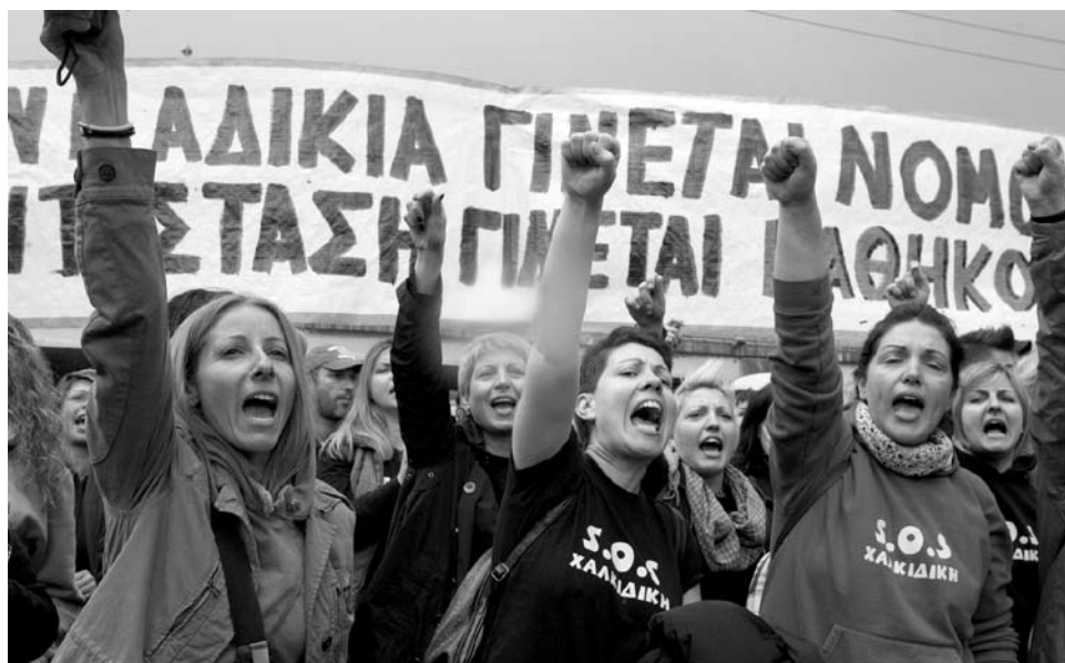
Manifestación contra la minería en Ierissos, Grecia

Pero he aquí que desde hace unos años está surgiendo otro Sur: el Sur del Norte . La gente más consciente de nuestro entorno ya sabe que uno de los objetivos de esta crisis provocada por la burbuja del crédito, especialmente en el Sur de Europa, es utilizar la deuda para aplicar recortes presupuestarios y desmantelar los derechos sociales, empo-